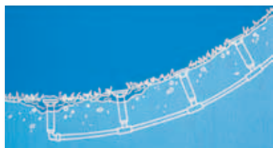
Bez zpětného ventilu SAM

Zpětný ventil Seal-A-Matic™ (SAM) brání vytékání zbytkové vody postřikovačem.